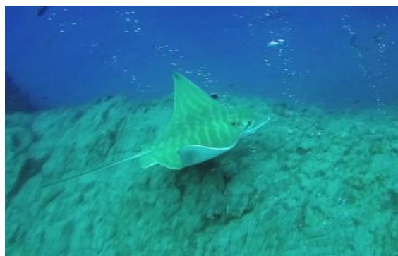
Raie aigle vachette: facilement reconnaissable grâce à sa tête de chien. Allez savoir pourquoi on n'appelle pas ça des raies-chiens!?!?