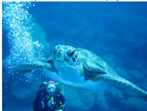
Une adorable petite tortue à la rencontre des plongeurs