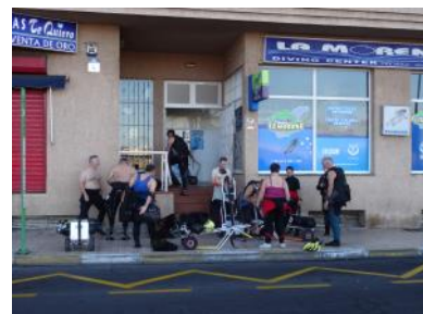
Le club étant situé à 200m du port, le transport des blocs se fait sur des petits chariots.