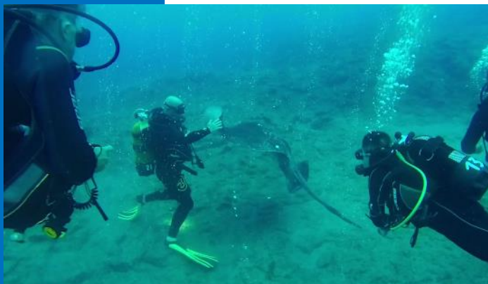
Raie africaine: La plus grande raie de l'atlantique, de 150 à 200 cm d'envergure. Elles sont curieuses et peu farouches.