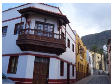
Garachico, ses rues colorées et ses piscines naturelles