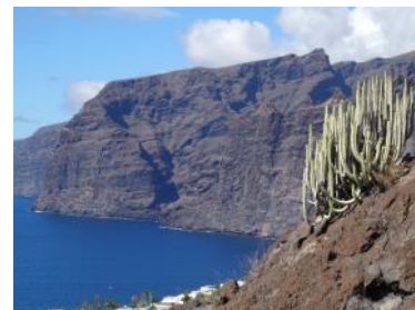
Les falaises de Los Gigantes

La pointe Nord Est de l'île, peu touristique et souvent dans la brume, montre un tout autre visage, rappelant la Bretagne.