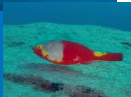
Poissons trompettes et perroquets omniprésents