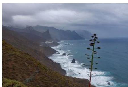
Ce jour-là, Bénijo avait un petit air de Bretagne !