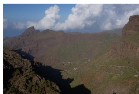
La route sinueuse et étroite qui conduit au village de Masca. Mieux vaut ne pas y croiser un bus!