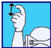
Purge ton gilet