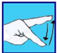
Palmage: plus d'amplitude