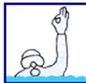
Ca va surface