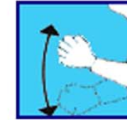
Difficulté passage réserve