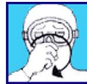
Je suis narcosé