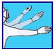
Prendre cette direction