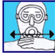
Panne d'air (Variante)