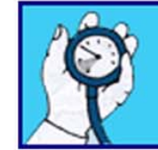
Montre ton manomètre