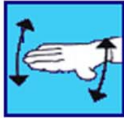
Ca va pas