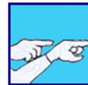
Conduis et je suis