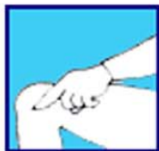
Ne plis pas tes jambes