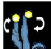
Ca va la nuit