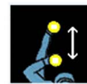
Ca ne va pas la nuit