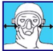
Equilibre tes oreilles