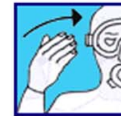
Venez vers moi