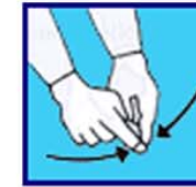
On se regroupe