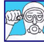
Je suis sur réserve