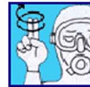
J'ai des vertiges