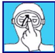
Equilibre ton masque