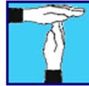
Demi - bouteille