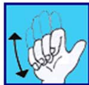
Gonfle ton gilet