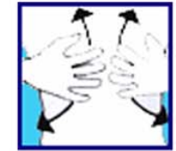
Je suis essouffé